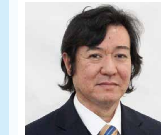
ハワード・ケン・ヒガ